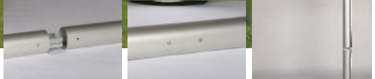
verschweißte Ecken bei Kreuzecken und am Bodenrahmen