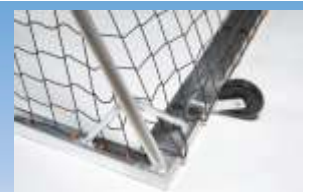
Eckausführung mit Bodenrohr