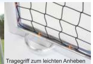
Tragegriff zum leichten Anheben